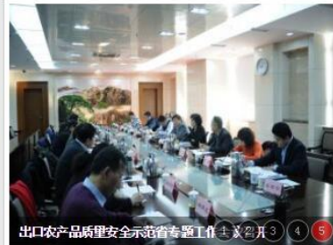
出口农产品质量安全示范省专题工作... 通知公告: 更多>>